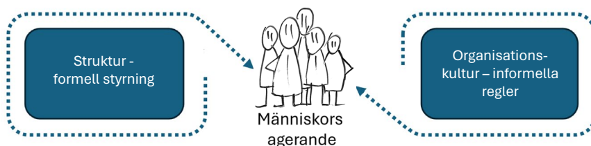
Figur 1. Människt handlande speglar struktur och kultur.

Människors handlande i en organisation förklaras av båda dessa delar. Handlingar och praktik uppstår i interaktionen dem emellan. Samspelet är dynamiskt och varken enkelriktat eller linjärt.